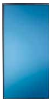
NIBE Aurinkopaneelit NIBE Solar FP215 P *Tuotenro 057001 (3 kpl)